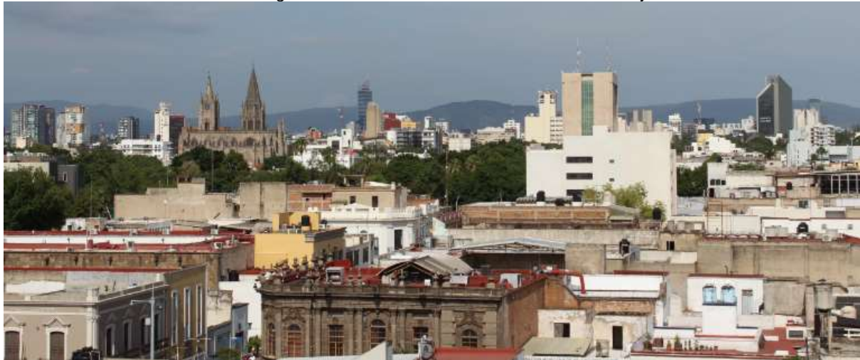
Imagen 1. Panorama de la Zona Centro de Guadalajara.